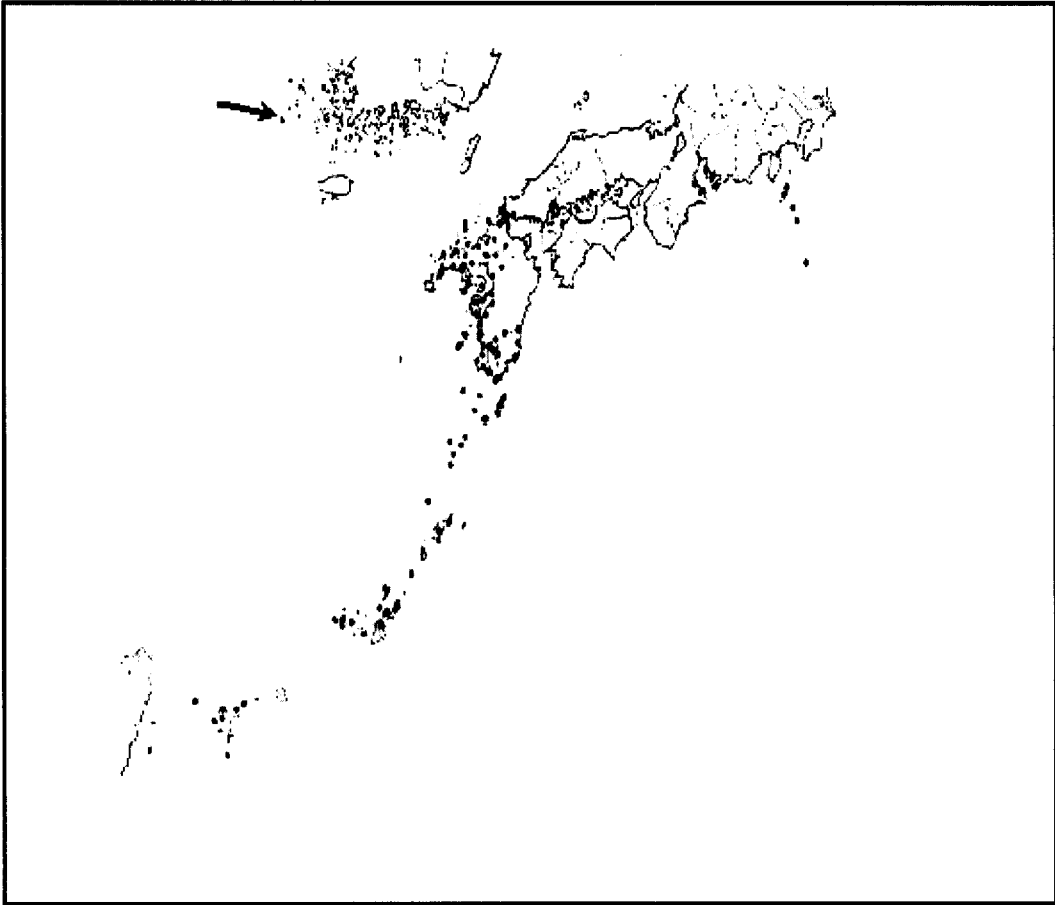
<Fig. 2> A distribution map of Viburnum japonicum (Thunb.) Sprengel ; This map was quoted from GINKGOANA(from Hara, 1983) and added one new distribution site.

( Ilex integra Thunb.), 아왜나무( Viburnum awabuki K. Koch), 붉가시나무( Quercus acuta Thunb.), 천전과나무( Ficus erecta Thunb.), 모람( Ficus nipponica Fr. et Sav.) 등의 난대림 수목이 주를 이루고 있다. 임상에는 풀고사리( Gleichenia japonica Spreng), 봉의꼬리( Pteris multifida Poir.), 가지고비고사리( Coniogramme japonica (Thunb.) Diels), 도깨비고비( Cyrtomium falcatum (L.) Presl), 홍지네고사리( Dryopteris erythrosora O. Kuntze), 별고사리( Cyclosorus acuminatus (Houtt.) Nakai), 실고사리( Lygodium japonicum (Thunb.) Sw.) 등의 양치식물이 많다.